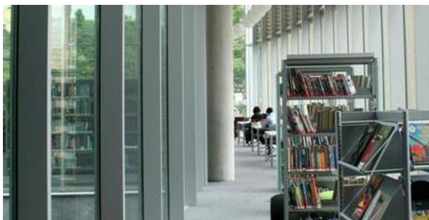
Leabharlann an Mhuilinn gCearr, Comhairle Contae na hIarmhí

I gcás ábhair shláinte, is mian le daoine níos mó a bheith ar eolas acu. Is mian leo braistint go bhfuil smacht acu ar a bhfolláine, tuiscint a fháil ar riochtaí agus bheith curtha ar an eolas faoi chóireáil agus cógais. Oibríonn an leabharlann mar acmhainn agus foinse tacaíochta. Tá fiúntas níos mó ag baint le forbairt leabhar lena mbaineann cúrsaí oidis agus fiúntas spriocábhair léitheoireachta mar ghné de sholáthar na leabharlainne.