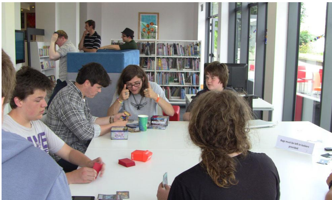
Leabharlann na Tuláí Móire, Comhairle Contae Uíbh Fhailí