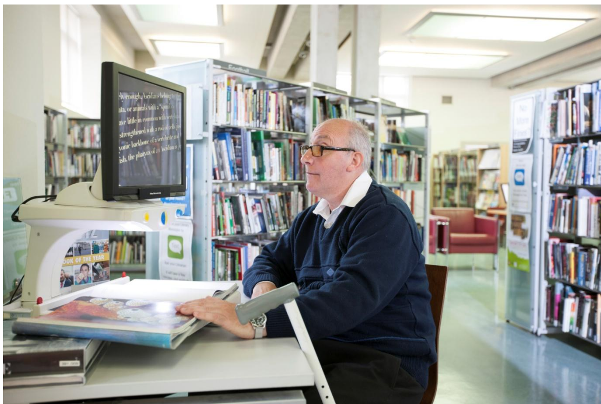
Lár-Leabharlann Johnston, Comhairle Contae an Chabháin

Roghnaítear úrscéal amháin ó údar a bhain gradam amach mar an ábhar dírithe don fhéile. Déanann daoine sna pobail áitiúla an t-úrscéal a léamh agus fiosraíonn siad téamaí agus stíleanna scríofa trí léachtaí agus ceardlanna. Cuireadh deireadh dearfach leis an bhféile le turas contae ag an údar a roghnaíodh. Baineann an lucht léite taitneamh as malartú feasach agus idirghníomhach leis an údar. Tá an-tóir ar an bhféile seo agus meallann sí léitheoirí nua.