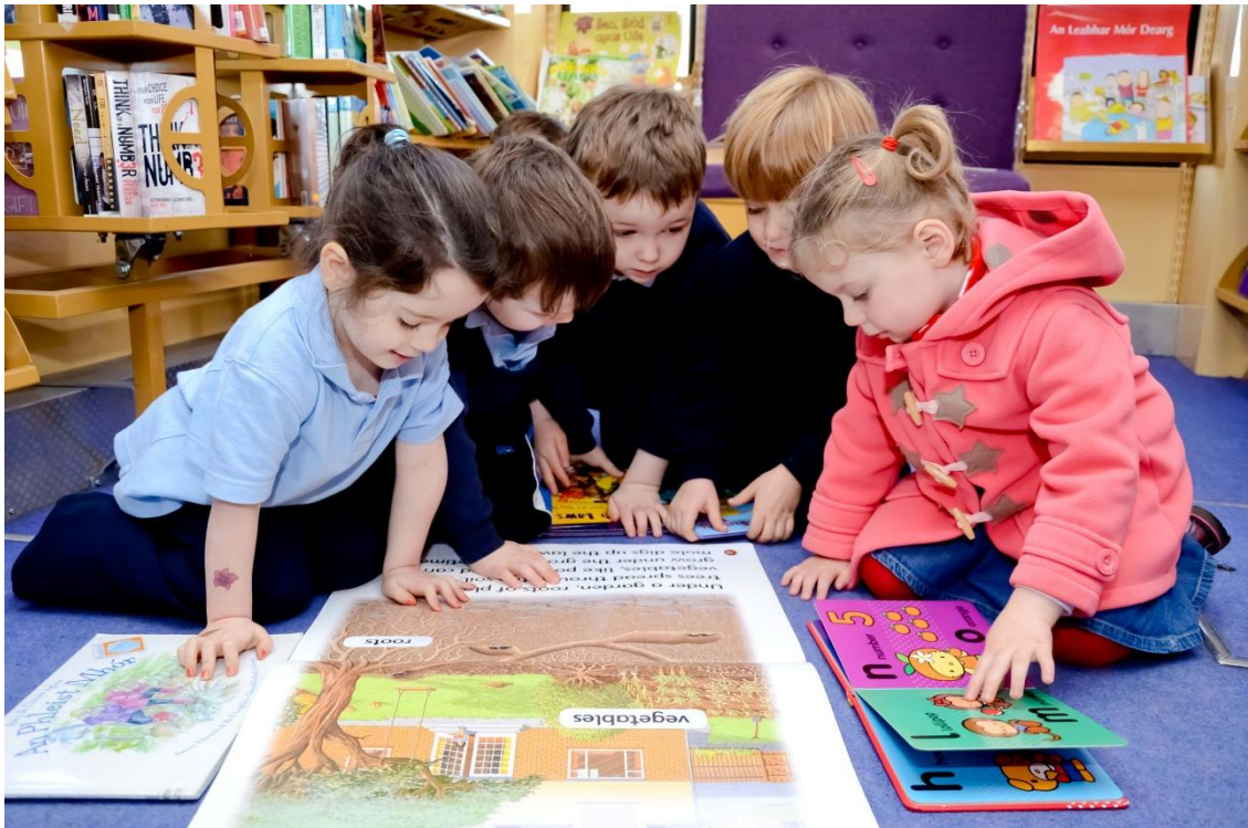
Leabharlann shoghluaiste, Comhairle Contae Ros Comáin

Díríonn an tionscadal is déanaí faoi Chlár Leonardo an AE ar oiliúint gairmoideachais foireann leabharlainne. I bpáirtíocht leis an mBulgáir, an tSlóivéin, an Rómáin, an Ostair, an Fhionlainn agus an tSeirbia, deonaíodh do Sheirbhísí Leabharlainne Chontae Mhuineacháin €18,000 chun samhail d'oideachas foireann leabharlainne a fhorbairt chun oibriú le cuardaitheoirí poist agus le daoine atá dífhostaithe le fada. Oibreoidh foirne an tionscadail ar fhorbairt clár ceardlann agus léachtaí don fhoireann agus beidh comhdháil ar siúl ina dhiaidh sin mar bhuaicphointe chun a dtorthaí a chur i láthair. Cruthóidh an tionscadal seo curaclam agus lámhleabhar don chúrsa oiliúna, ar féidir é a dháileadh ar institiúidí eile seirbhís leabharlainne agus oideachais.