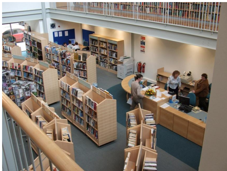
Leabharlann Bhéal an Átha Móir, Comhairle Contae Liatroma

Tá freagracht ar an leabharlann chun faisnéis phobail áitiúil agus chultúrtha a bhailiú agus a chur ar fáil lena chinntiú go mbíonn rochtain ar fáil ar ábhar a bailíodh áit eile sa leabharlann poiblí.