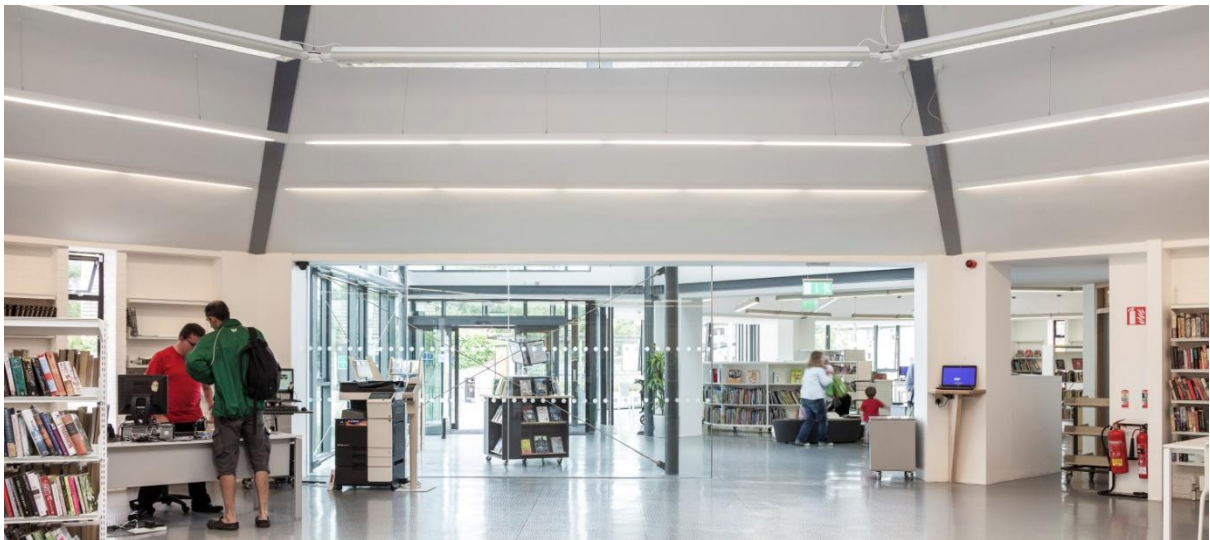
Leabharlann Gráinseach an Déin, Comhairle Contae Dhún Laoghaire-Ráth an Dúin

Ba léir gur theastaigh beartas náisiúnta a raibh soláthar méadaithe foirne agus clár cistithe chaipitiúil mar bhonn agus taca leis, chun caighdeán maith comhsheasmhach de sheirbhís leabharlainne poiblí a sholáthar i ngach ceann de na tríocha a dó údarás leabharlainne. I 1998, d'fhoilsigh an Roinn an chéad straitéis do leabharlanna poiblí, plean costáilte agus lenar chomhaontaigh na páirtithe leasmhara le haghaidh seirbhís nua-aimseartha.