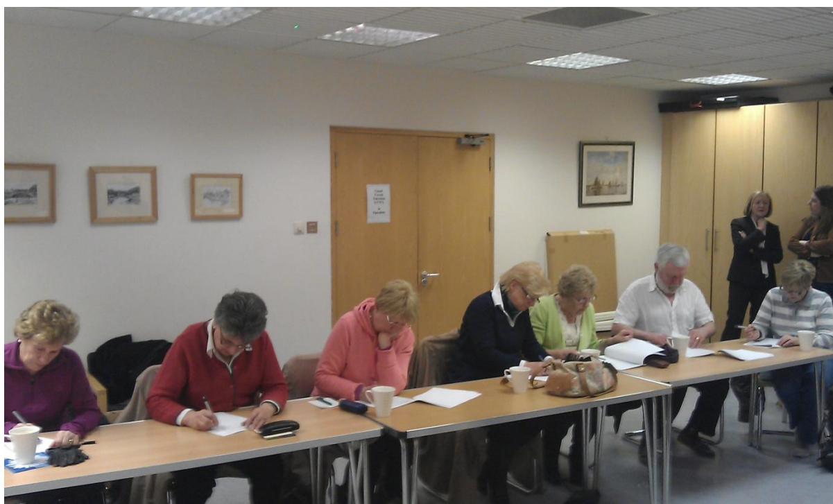
Daoine Breacaosta, Baile Átha Cliath Theas