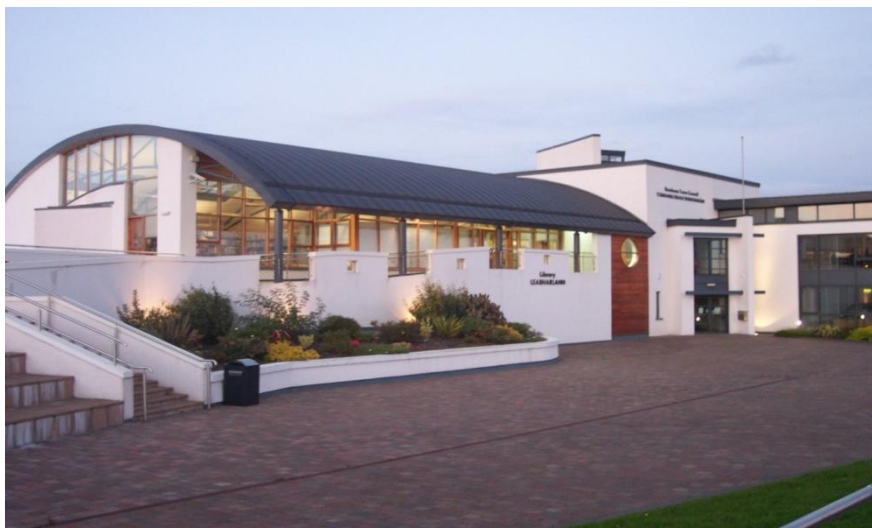
Leabharlann Bhun Dobhráin, Comhairle Contae Dhún na nGall