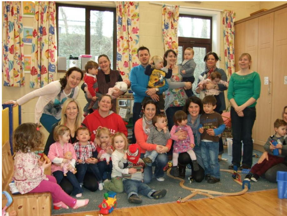
Tuismitheoirí leanaí óga, Cathair Luimnigh