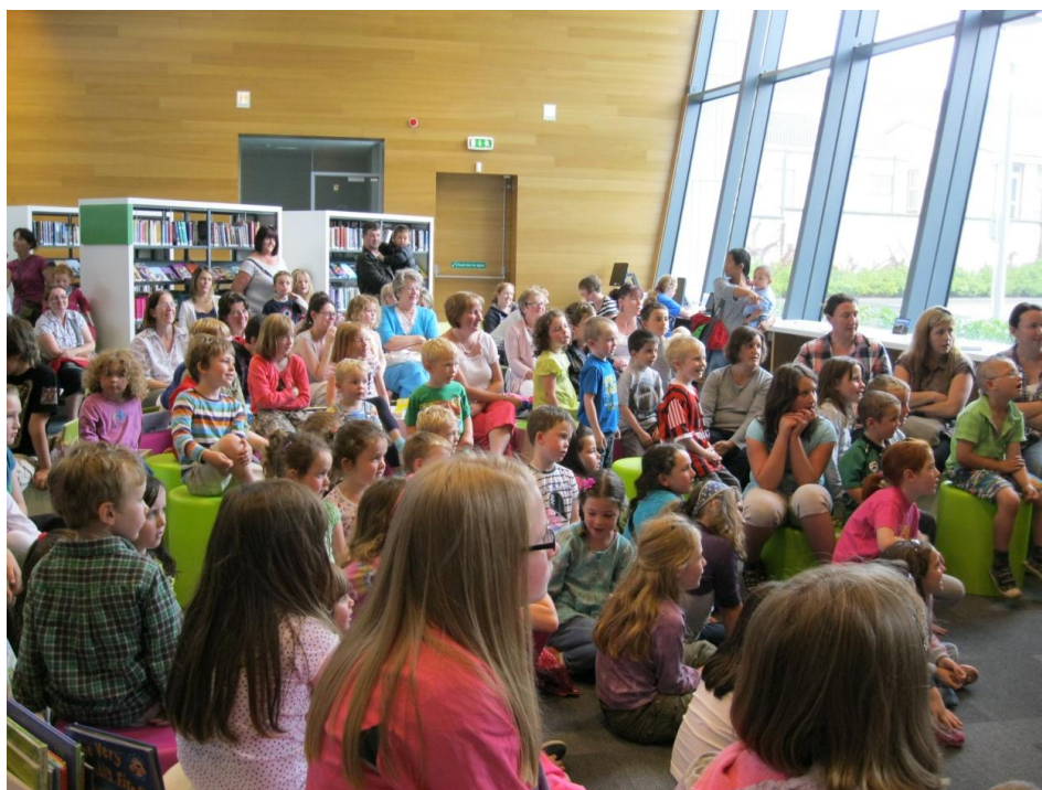
Clár Dúshlán Léitheoireachta Samhraidh ag Leabharlann Ghuaire, Comhairle Contae Loch