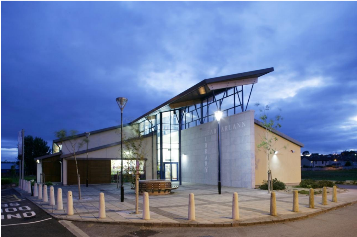
Leabharlann an Taoibh Thiar, Comhairle Contae na Gaillimhe, arna hoscailt in Eanáir 2004

Branching Out: Rinne A New Public Library Service (1998) sraith moltaí a bhí dírithe ar sheirbhís nua leabharlainne poiblí a fhorbairt don 21ú haois, lena n-áirítear an méid a leanas: rochtain dhaonlathach ar fhaisnéis a sholáthar, tacaíocht a thabhairt d'fhoghlaim feadh an tsaoil agus ar thacaíocht phobalbhunaithe le haghaidh oiliúint litearthachta agus léitheoireachta. Bunaíodh an straitéis ar chumas leabharlann poiblí a uasmhéadú chun cur go mór le cuspóirí Rialtais, go háirithe i limistéir na sochaí faisnéise agus eolais agus cuimsithe shóisialta agus gheilleagraigh.