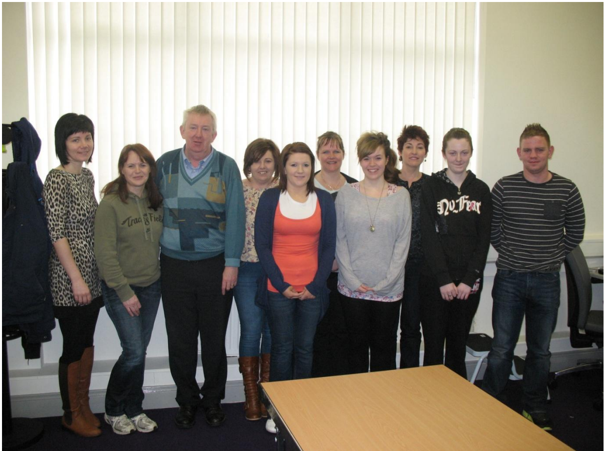
Foghlaimoirí Aosacha, Contae Dhún na nGall