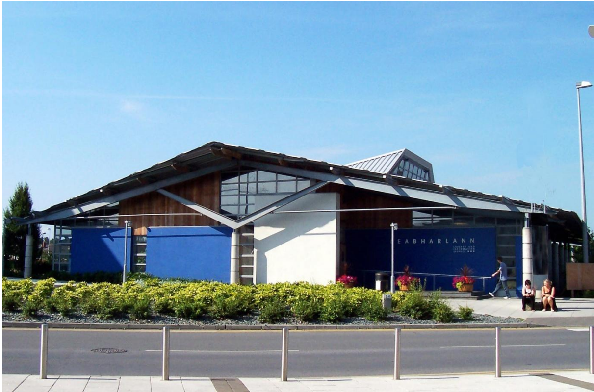
Leabharlann Thuar an Daill, Comhairle Contae Luimnigh

Bhunaigh na straitéisí Branching Out fóram inar féidir le gach páirtí leasmhar teacht le chéile agus chun fíis dhearfach agus chuimsitheach a chruthú le haghaidh leabharlanna poiblí agus d'eascair beartas daingean agus dea-chruthaithe as seo a rinne seirbhísí, foirgnimh agus acmhainní a bhunathrú. Mar gheall go ndearnadh dul chun cinn suntasach sa dá straitéis roimhe seo, is tábhachtach cur leis an méid torthaí a baineadh amach cheana féin. Agus sinn thíos le timpeallacht dhifriúil gheilleagrach agus le rialtas áitiúil atá i mbun athrú, teastaíonn straitéis nua chun freastal ar dhúshláin agus ar dheiseanna nua.