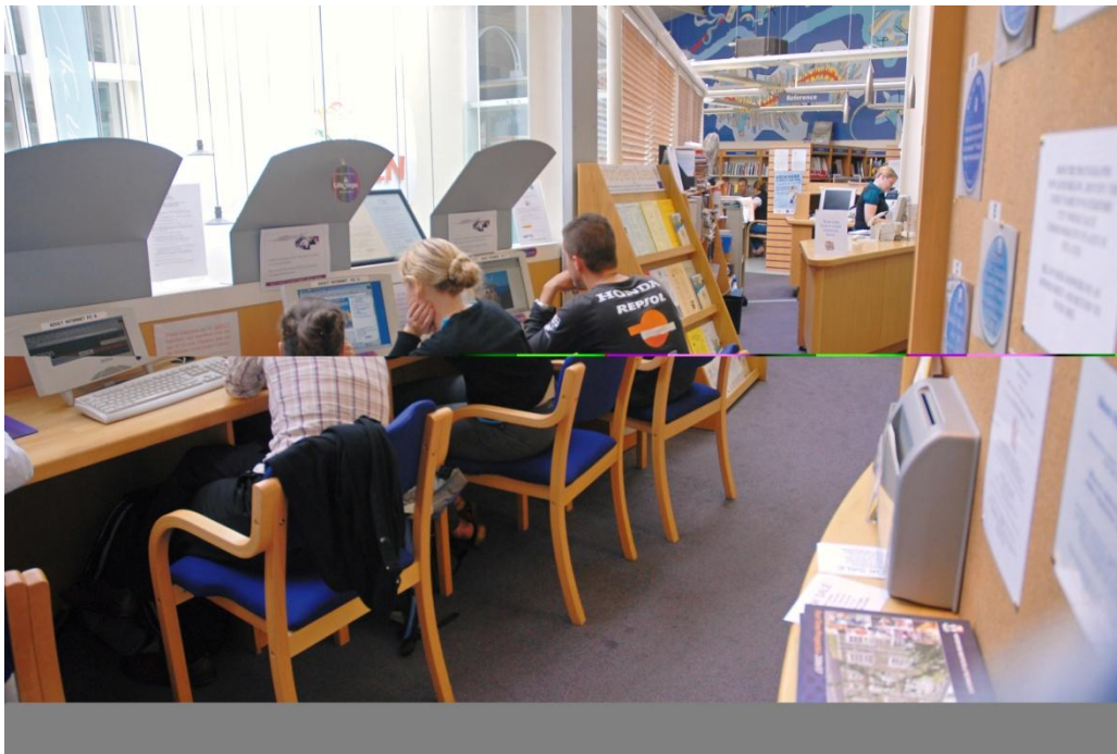
Leabharlann Ard Caoin, Comhairle Cathrach Phort Láirge

Comhpháirtithe Sheirbhís Leabharlainne Chill Chainnigh, VEC Chill Chainnigh agus ranganna ríomhaireachta á soláthar ag Leabharlann Phort an Chalaigh i gCill Chainnigh Theas. Tá an tionscnamh seo ar cuireadh tús leis i bhFeabhra 2013, á chistiú ag Seirbhís Oideachas Pobail VEC Chill Chainnigh a dhéanann an teagascóir a sholáthar chomh maith. Soláthraíonn an leabharlann an t-ionad, na ríomhairí agus an cur chun cinn. Cuimsíonn na ranganna bunscoileanna TF agus bíonn siad ar siúl ar feadh dhá uair an chloig sa tseachtain ar feadh sé seachtaine.