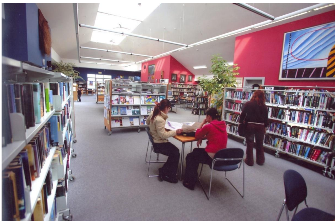
Leabharlann Lios Tuathail, Comhairle Contae Chiarraí