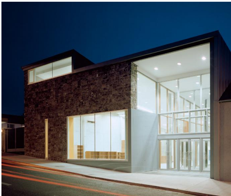
Leabharlann Thobair an Choire, Comhairle Contae Shligigh

Díscaoileadh an Chomhairle Leabharlann an 31 Deireadh Fómhair, 2012 agus aistríodh a gcuid feidhmeanna go dtí Forbairt Leabharlann, roinn nua den LGMA.