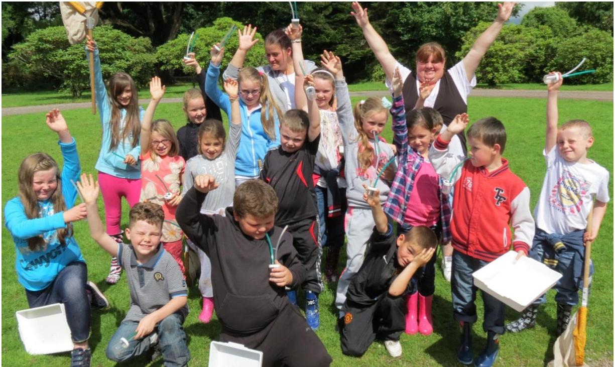
Bhí grúpa fócais ar bun le comhaltaí Ionad Óige an Chinn Thiar, Cathair Luimnigh